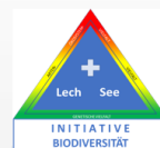
Abb.: Zielarten Natura 2000 Gebiet Tiroler Lech